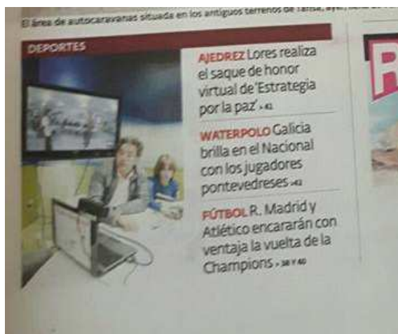
Portada Diario de Pontevedra

“El alcalde da el saque de honor al proyecto ajedrez, estrategia por la paz”